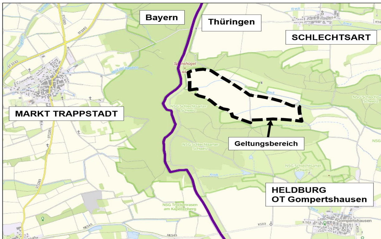
Übersichtslageplan 2 mit Geltungsbereich (schwarz gestrichelt) des Bebauungsplans „Solarpark Gompertshausen“ der Stadt Heldburg (Kartengrundlage: basemap.de; ohne Maßstab)