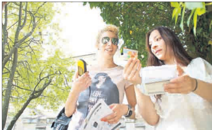
Geocaching eignet sich für Schüler ab der vierten Klasse. Ausführliche Informationen zum Geocaching unter: www.rodachtal.info