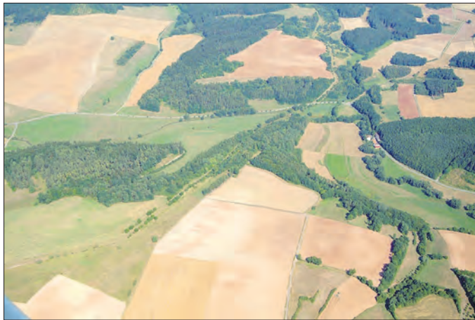
Grünes Band bei Ummerstadt