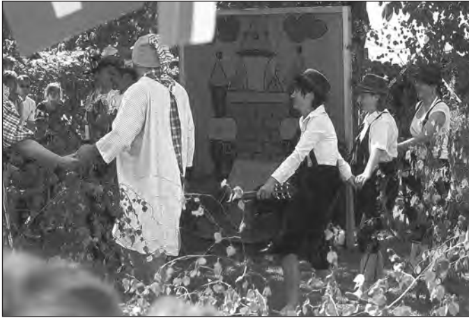
Märchenspiel „Die goldene Gans“