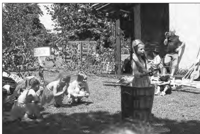
... in Indien