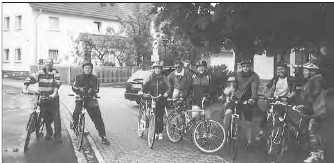
Radfahrerguppe im Rodachtal

Interessierte können sich die Übersichtskarte auf der Internetseite der Initiative Rodachtal unter http://www.initiative-rodachtal.de/index.php?article_id=118 anschauen oder herunterladen.