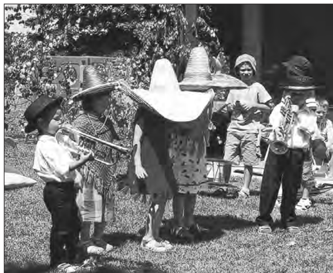
Sommerfest in Mexiko