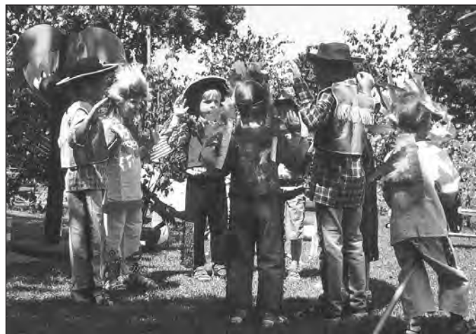
... in Amerika