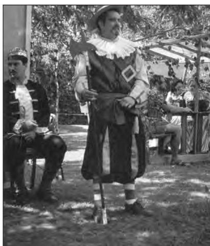
Eltern der Schulanfänger beim Märchenspiel